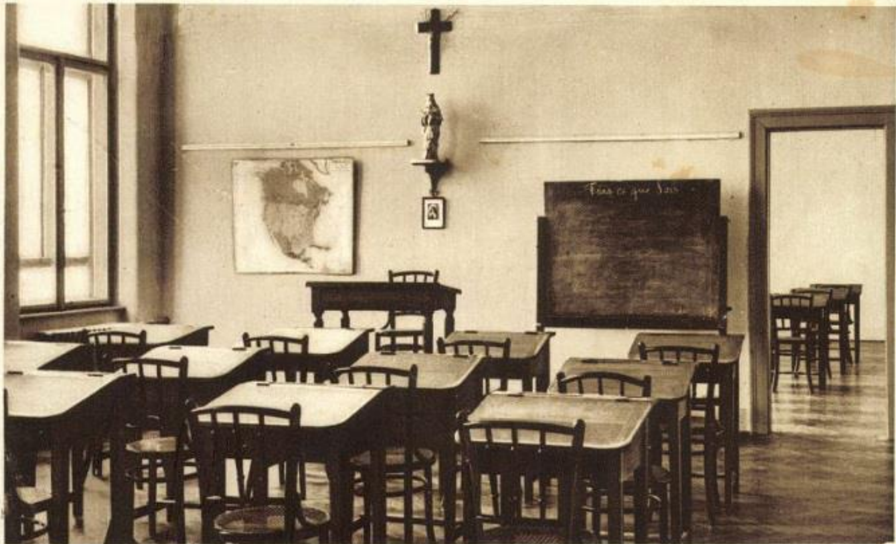
Pensionnat Notre Dame de Sion Buda Sashegy