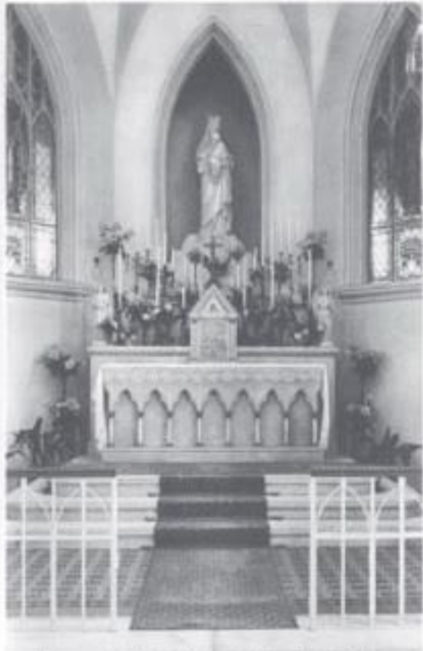
Mission of Notre Dame de Sion Buda Sashogy Chapelle