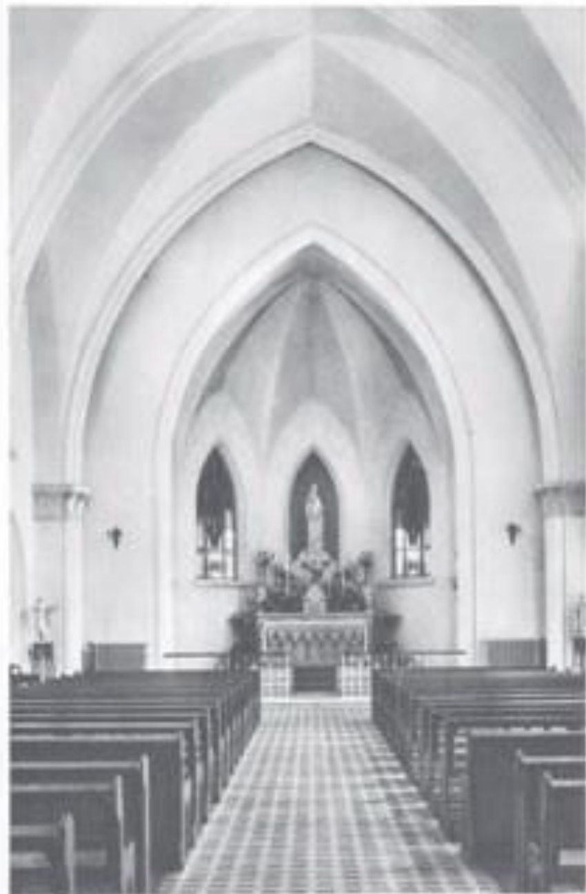
Mission of Notre Dame de Sion Buda Sashogy Chapelle