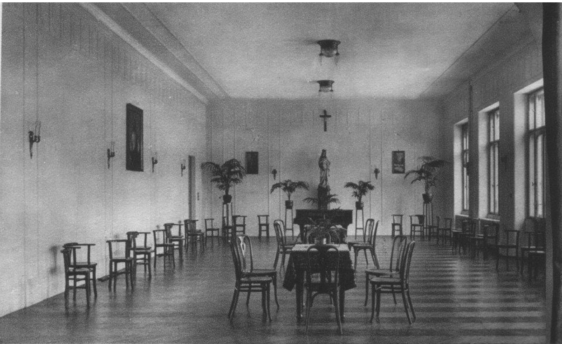
Pensionnat Notre Dame de Sion Buda Sashegy