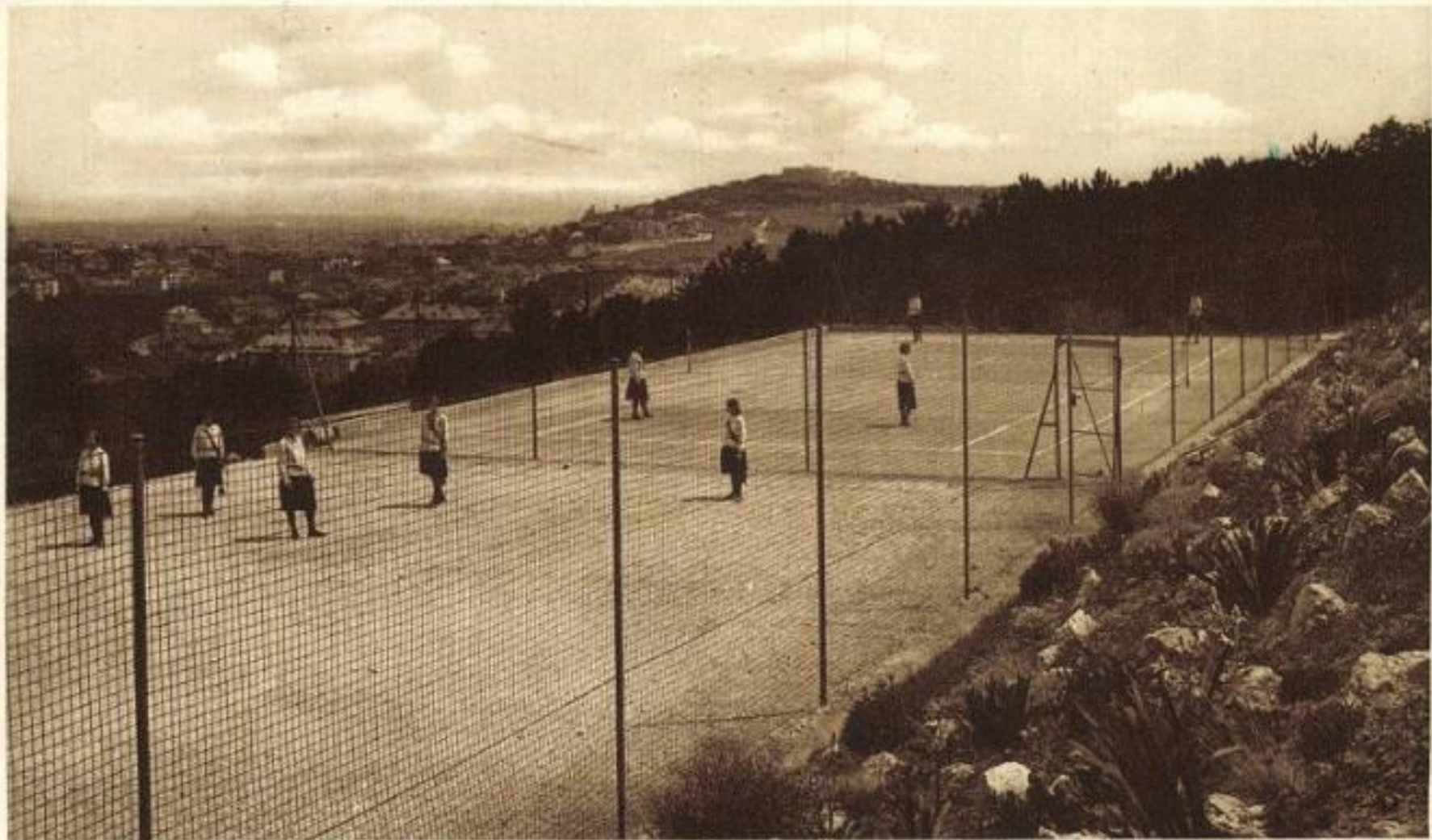
Pensionnat Notre Dame de Sion Buda Sashegy et Panorama vers la Citadelle