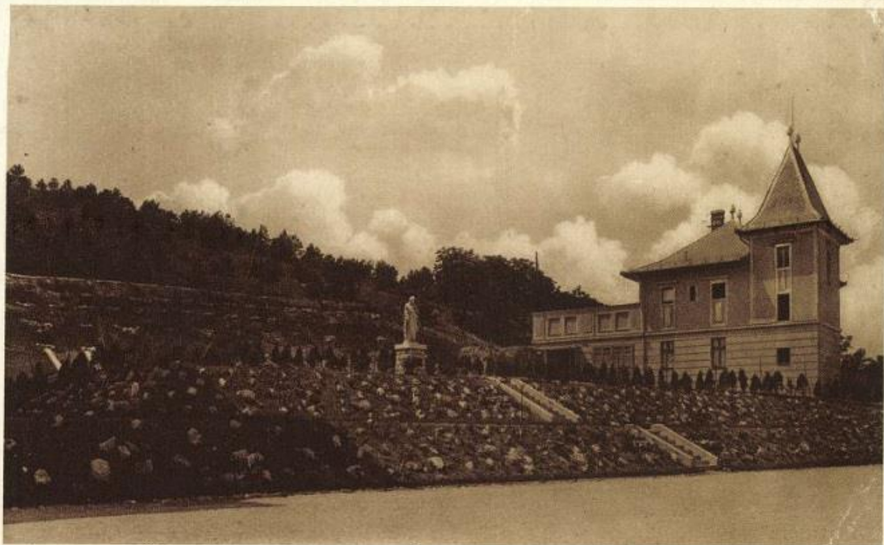
Pensionnat Notre Dame de Sion Buda Sashegy Terrasses du Sacré Coeur et Aumônerie