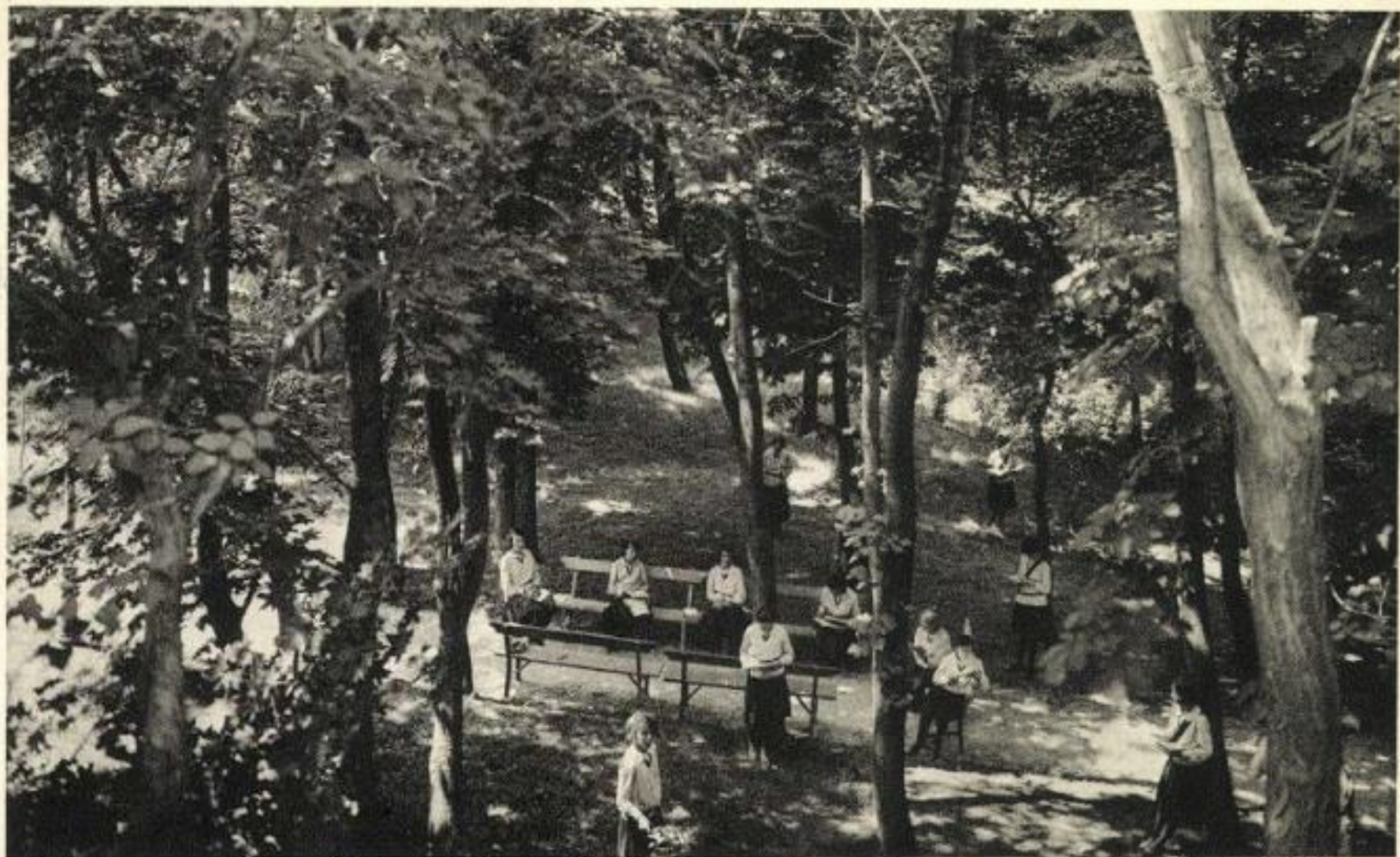
Pensionnat Notre Dame de Sion Buda Sashegy