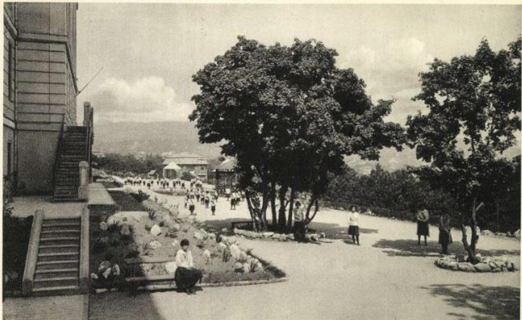
Pensionnat Notre Dame de Sion Buda Sashegy