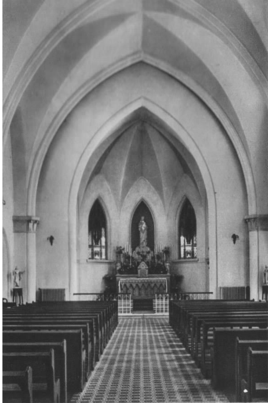
Pensionnat Notre Dame de Sion Buda Sashegy Chapelle