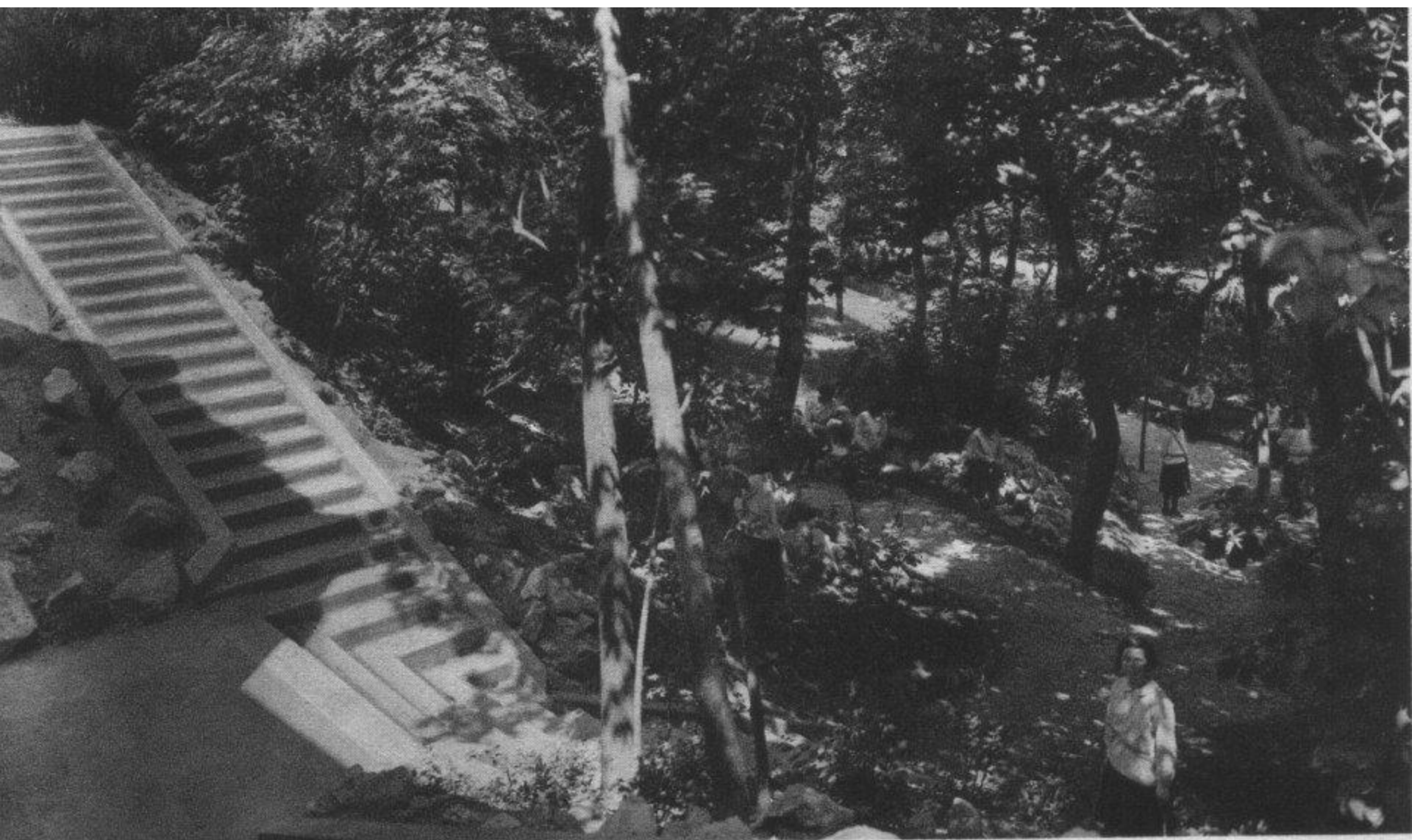
Pensionnat Notre Dame de Sion Buda Sashegy